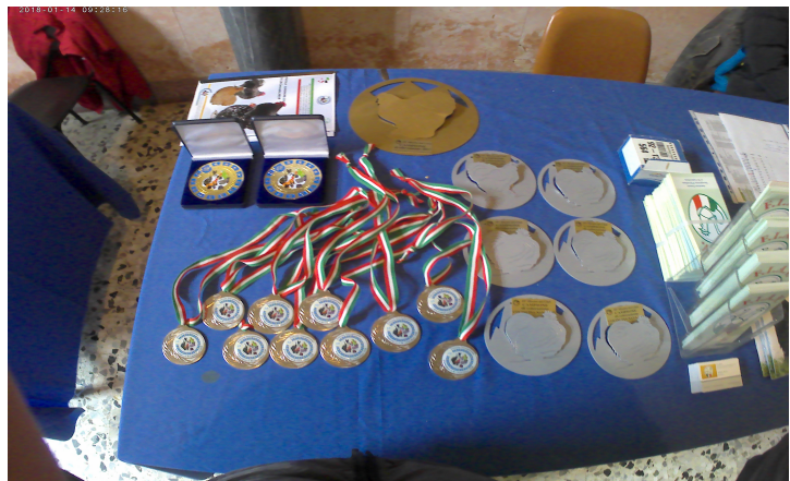
X Mostra del Club e Mostra Europea– Albisola S. (SV) 13/14 gennaio 2018