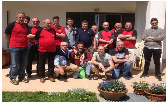
XI Assemblea del Club – Loano (SV) 22 aprile 2018