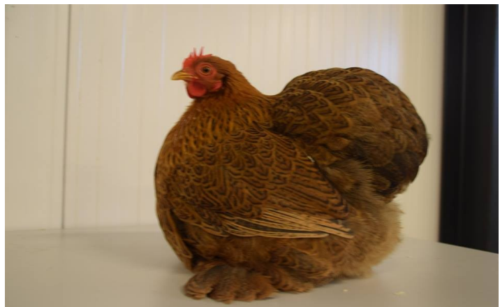
XIII Cochinday – Tiel (NL) 11 novembre 2017