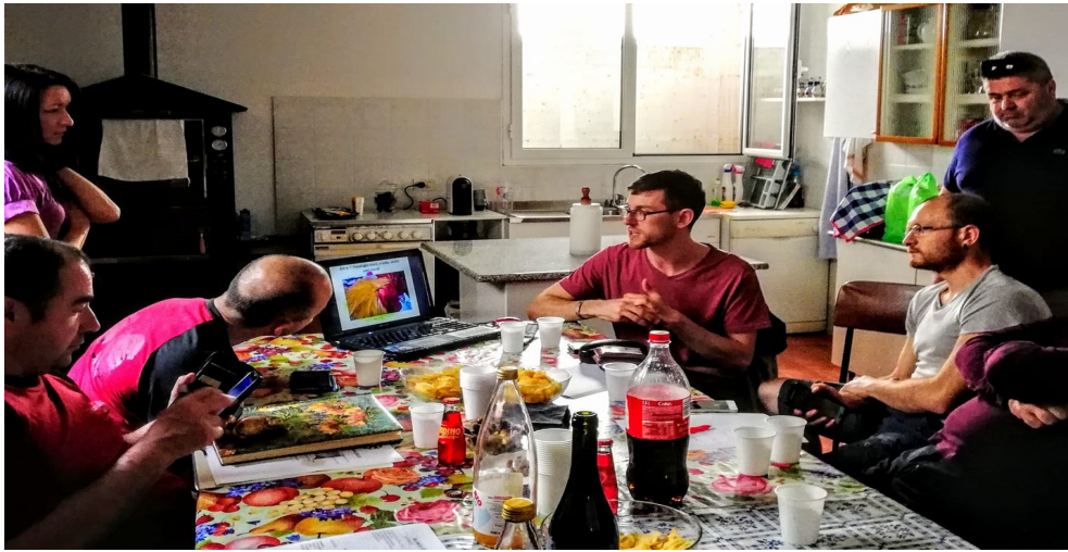
XI Assemblea dei soci del Club Italiano della Cocincina